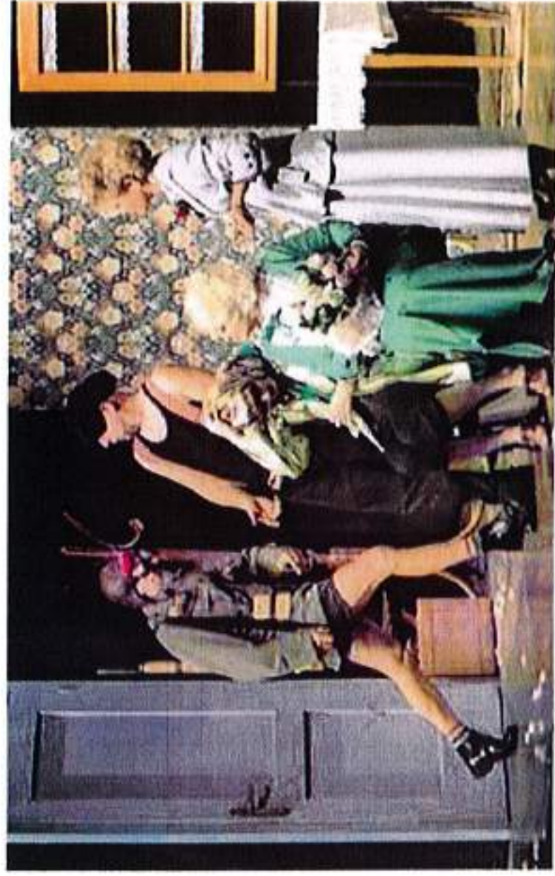
• Un momento della commedia

La prevendita è in corso alla Filodrammatica di Laives e online.