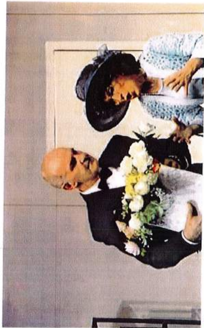
• Un momento dello spettacolo

La prevendita è in corso all'ufficio della Filodrammatica di Laives (0471-952650).