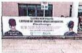
Il 10 ottobre la giornata contro la tratta degli esseri umani

Laves. Anche Laves partecipa alla "Giornata contro la tratta degli esseri umani" che si svolge il 10 ottobre.