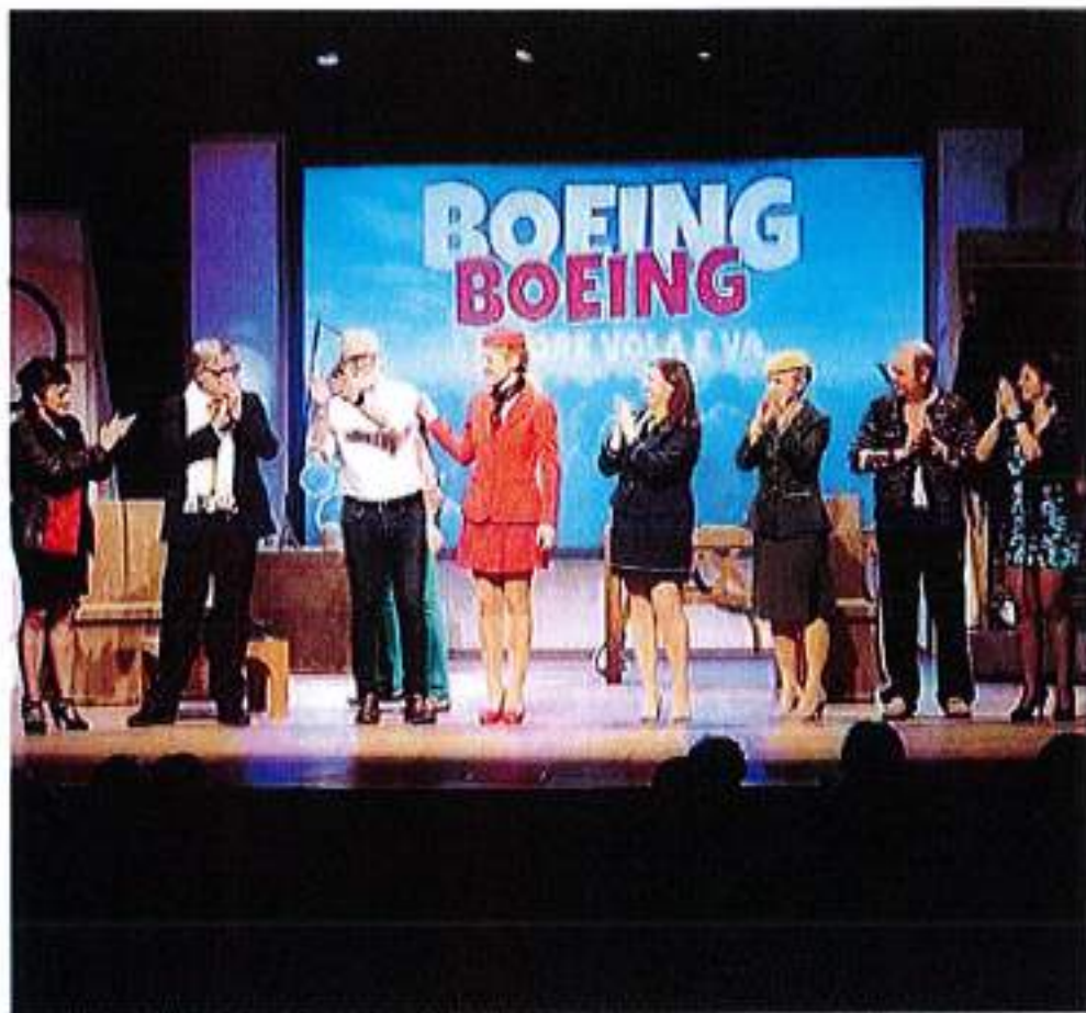
Una delle commedie della rassegna teatrale di Laives

Col passare delle edizioni, la rassegna è diventata una delle più importanti al livello nazionale. «Un crocevia di lingue - come ha detto Frazza - espressioni, costumi, tradizioni e comicità che al bracciano l'intera penisola, perché dal teatro di Laives sono passate compagnie provenienti da tutta Italia, per porta-