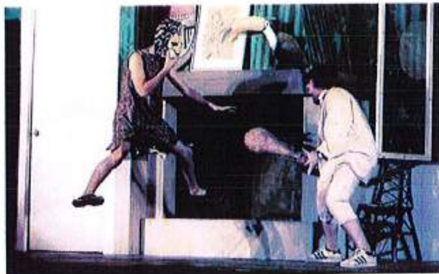
• La compagnia veronese “La Graticcia”

LAIVES. Un venerdì sera a teatro, è quello che propone la Filodrammatica di Laives per dopodomani, venerdì appunto, alle 20.45, al teatro Gino Coseri di Laives per la seconda commedia in programma al concorso nazionale di teatri dialettale “Stefano Fait”. Sul palco la compagnia veronese “La Graticcia”, per proporre i due atti, in dialetto veneto: “È tutta una farsa”. La prevendita dei biglietti d'ingresso è già in corso presso la Filodrammatica di Laives (0471-952650) o www.teatro-filolaives.it/biglietti .