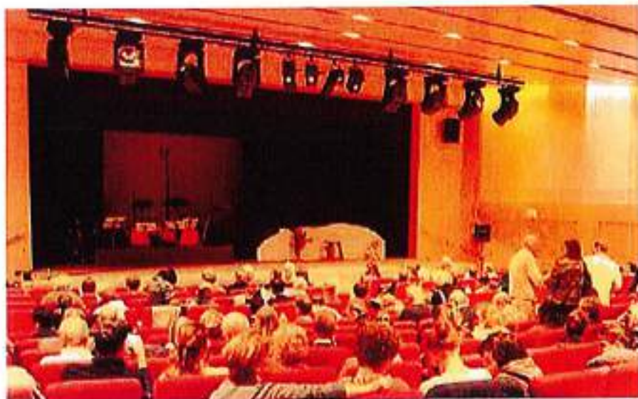
• La sala piena di gente al teatro Coseri