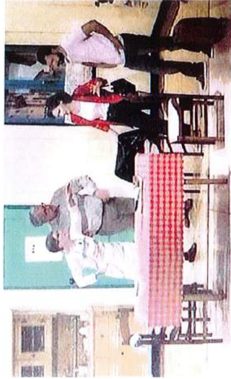
• La commedia “Tut colpa de l’ors”

La prevendita è in corso presso la Filodrammatica o sul sito www.teatrofilolaives.it