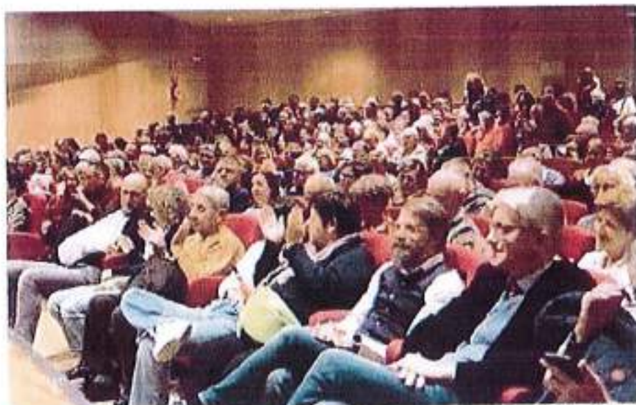
« Tutto esaurito al debutto della Rassegna di teatro dialettale »

LAIVES. Avvio con tutto esaurito per la 15esima Rassegna nazionale di teatro dialettale organizzata dalla Filodrammatica di Laives alla sala "Gino Coseri". Soddisfazione per gli organizzatori e successo per la compagnia Filodrammatica di Rumo che ha portato in scena "Tuta colpa de Fors". Prossimo appuntamento venerdì 8 novembre sempre al teatro Gino Coseri con la compagnia La Graticcia di Verona e la sua "E' tutta una farsa", commedia di vertentissima in dialetto veneto di Ermanno Carzana.