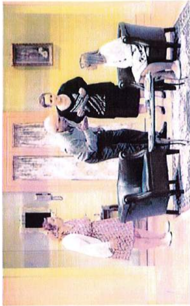
• La commedia "Il morto sta bene in salute"

La prevendita è in corso chiamando lo 0471-952650 o sul sito www.teatrofilolaves.it/biglietti . Saranno due atti di gag esilaranti e molti colpi di scena.