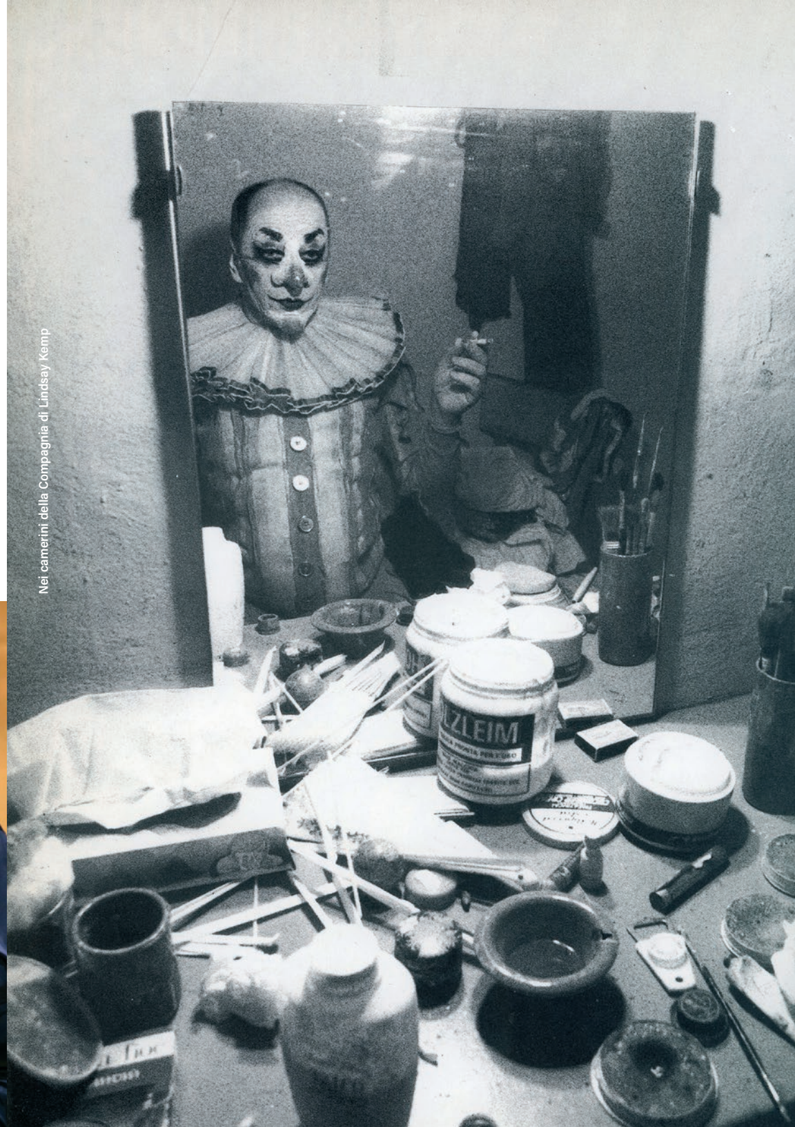
Nei camerini della Compagnia di Lindsay Kemp